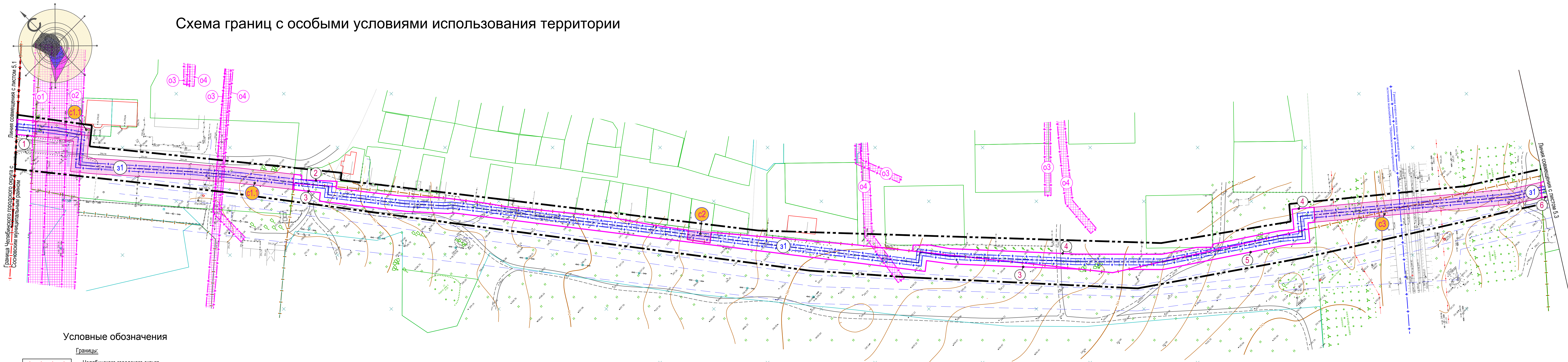
Схема границ с особыми условиями использования территории