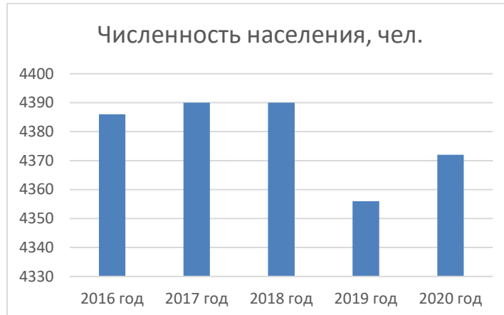
Рисунок 2.1 Динамика изменения численности населения Мирненского СП (2016-2020 гг., данные на начало года)

Из таблицы 1.1 следует, что с 2016 г. по 2020 г. численность населения Мирненского СП уменьшилась на 14 чел.