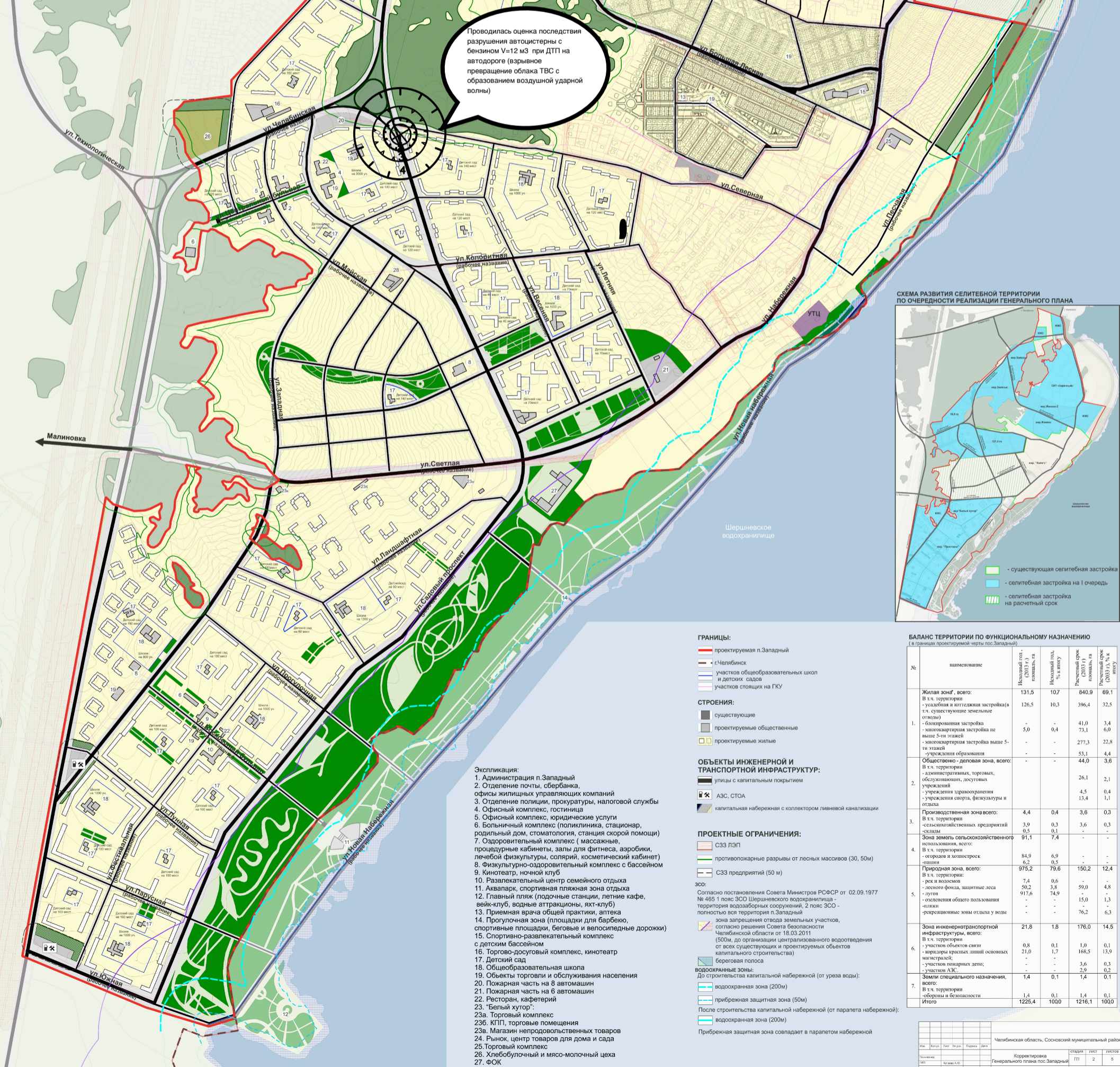
СХЕМА РАЗВИТИЯ СЕЛИТЕБНОЙ ТЕРРИТОРИИ ПО ОЧЕРЕДНОСТИ РЕАЛИЗАЦИИ ГЕНЕРАЛЬНОГО ПЛАНА