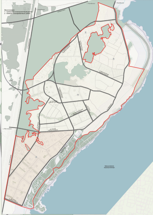
СХЕМА РАЗМЕЩЕНИЯ ПЛАНИРОВОЧНЫХ РАЙОНОВ ПОС. ЗАПАДНЫЙ. М 1:20 000

КОРРЕКТИРОВКА ГЕНЕРАЛЬНОГО ПЛАНА ГЕНЕРАЛЬНЫЙ ПЛАН. ОСНОВНОЙ ЧЕРТЕЖ М 1:5000