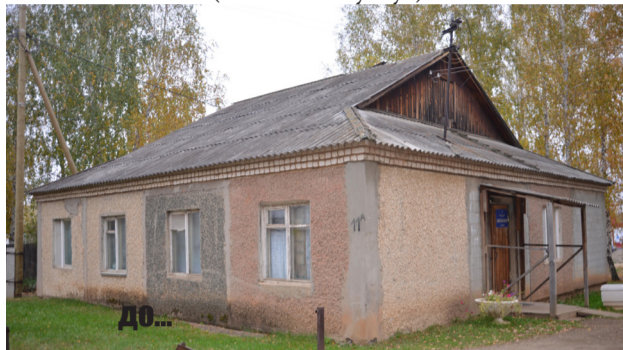
Полетаевская ДЮСШ (бывшая амбулатория)

Ремонт ограждения спортивной площадки Ленина 17; Благоустройство территории Ленина 11,13, Фабричная 3,1; Устройство тротуаров и парковки ул. Ленина 11, 13 Фабричная 1, 3; Устройство тротуаров Фабричная 6, Ленина 21 Огнезащитная обработка крыши в здании д. Казанцево; замена дверных полотен по коридорам спортзала; Замена светильников в классах и коридорах; испытание пожарных рукавов; испытание на прочность наружных лестниц в школьном здании Замена уличных фонарей и установка наружных видеорекамер в школе Ремонт кровли, замена входных дверей в нач. школе Приобретение школьного автобуса Монтаж пожарных сигнализаций спортзала ДК Приобретение видеопроектора для Рощинского ДК Монтаж видеонаблюдения в Рощинском ДК Пошив костюмов (из платных услуг)