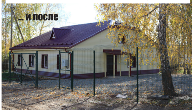
... и после